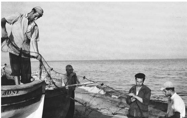
Pescadors masnovins a la platja.