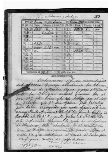
Pàgina d'un quadern de bitàcola, amb el final dedicat a la Mare de Déu de la Cisa.

Dèiem que podria ser un formulisme aquest acabament, ja que en la correspondència personal, tant d'aleshores com fins a temps ben propers, ara encara hi ha qui ho fa, era costum que, o bé al començament de la carta o bé al final, la persona que escrivia, després de posar que Gràcies a Déu ell estava bé, el mateix desitjava a la persona a la qual es dirigia; i més i tot, encara he pogut com-