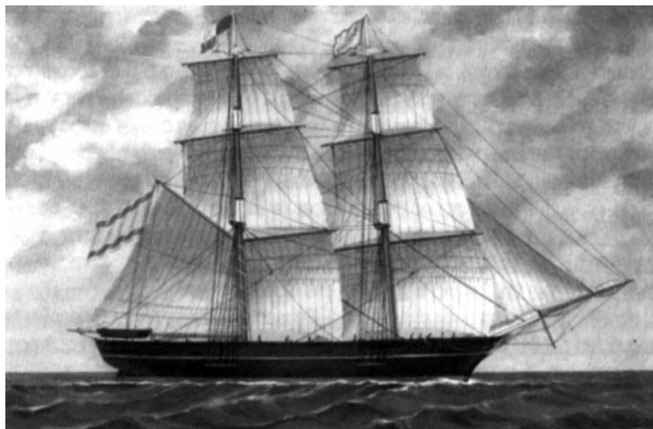
Vaixell masnoví pintat de negre, segons un costum local.

Darrerament, també s'han trobat certs documents que diuen que els vaixells dedicats a la pirateria i al tràfic de