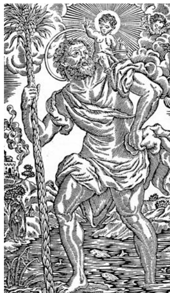
Sant Cristòfol, que se celebra el dia 10 de juliol, dia que era costum, anys ha, de començar els banys a mar.