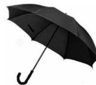
Paraigua, l'únic estri que encara segueix essent superstitió de portar a bord dels moderns vaixells.