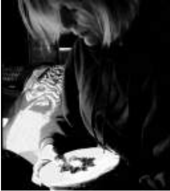
La Fusellas escolpint amb roba i fil.

però, per temes pràctics, econòmics, vaig fer un gir acadèmic. Ara, l'univers em tornava al meu lloc fent-me aquest regal inexplicable.