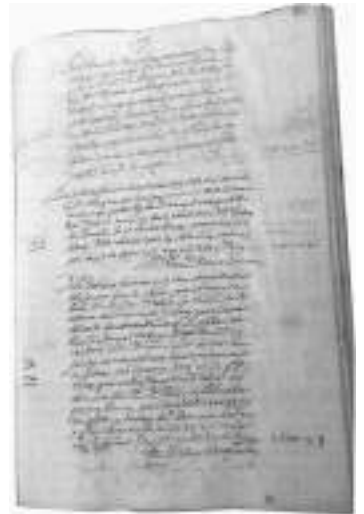
Pàgina 85 del mateix llibre.

Primer cal fer algun aclariment, com el del nom "Mas Torre del Molí", que era el nom amb què es coneixia antigament l'actual Mas Teixidor. Aquest, ara dins el terme municipal del Masnou, era aleshores, i fins al 1846, dins el terme d'Allella. Després, el dia de "Nostra Senyora de març", o Mare de Déu de març, correspon al dia 25 de març, o sigui, a la festivitat cristiana de l'Anunciació de l'Àngel a la Mare de Déu. I, finalment, "el comte de la