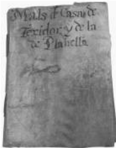
Coberta del llibre Mals de casa Teixidor y de la de Planella, del 1712 al 1740 .

Després d'aquesta introducció, passem a l'estudi dels documents. Es