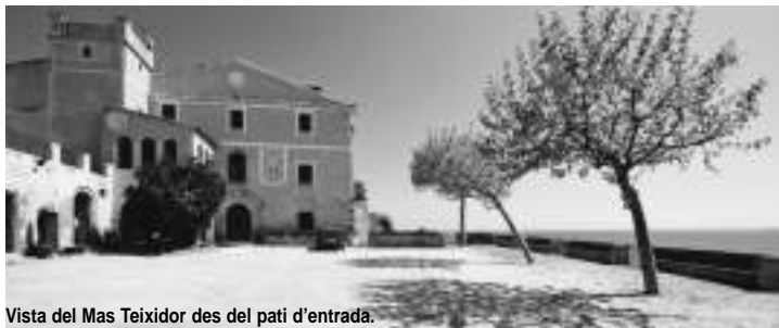
Vista del Mas Teixidor des del pati d'entrada.