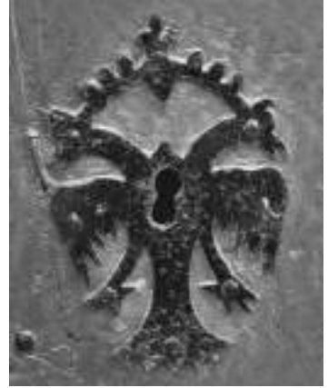
Escut de pany, amb l'àliga bicéfala, indicatiu que la casa era d'un austriacista.

prés de la capitulació de Barcelona. Aquest és un fet més que corrobora el títol d'aquest treball, normalitat dins un context tràgic.