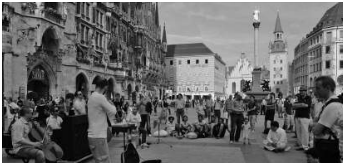
Músics amb audiència a la plaça Marienplatz al cor de Munic