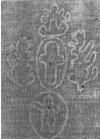
Marca d'aigua de l'esmentat llibre.