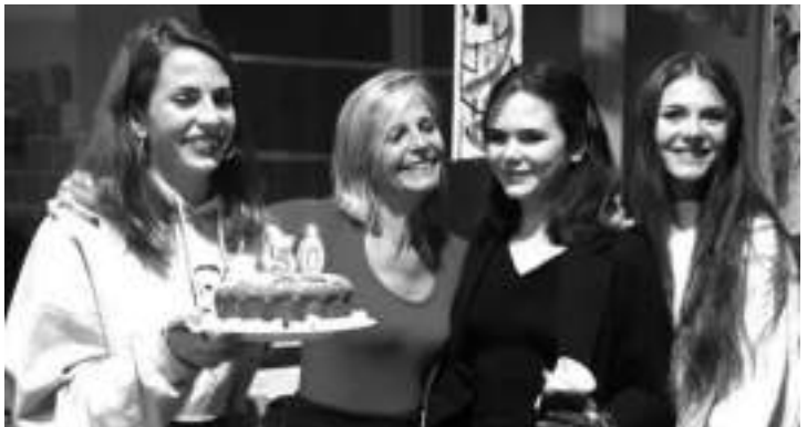
Amb les seves tres filles celebrant el seu aniversari

La veritat és que no ho feien, o jo no en tinc la sensació. Després em van enviar als jesuïtes, i això va ser una altra història. No vaig connectar. Jo no soc religiosa perquè, com ho tinc entès, ja has entrat en el dogma. I els dogmes són cotilles, en totes les esferes, que capen. Sí que soc molt espiritual. És un àmbit que he treballat i treballat molt perquè em fa créixer i ser millor persona. Si m'haig de definir, et diria que em sento a prop del protocristianisme, de l'arrel, aquella arrel que comparteixen totes les religions quan rasques una mica. I que no deixen de ser els valors de la humanitat. Crec en aquesta energia còsmica que pots anomenar déu, univers, quàntica o com cadascú se senti més còmode. Jo soc d'una cultura concreta, la nostra, i he fet les paus amb les paraules.