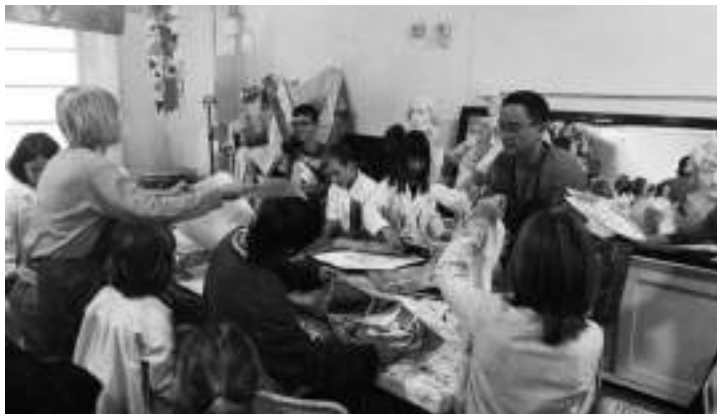
Amb el rebombori de classe a Blanc de Guix

Una vegada vaig acabar la carrera, vaig adonar-me del poc que encaixava jo a