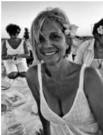
Berenar a la platja amb amigues

En aquest món, no ets lliure si no pots pagar les factures del que necessites comprar per viure. En aquest món capitalista en què vivim, una part de la poca llibertat que encara ens queda, la decideixen els teus ingressos. Això no ho hem