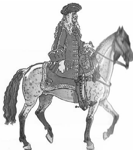
Rafael Casanova i Comes, segons un dibuix, en el qual es pot apreciar bé com era el vestit de Conseller en Cap. Del llibre "La Guerra de Successió dia a dia". Sàpiens.

Aquell 30 de novembre de 1713, que fou la darrera vegada que s'escollia Conseller en Cap i els altres càrrecs