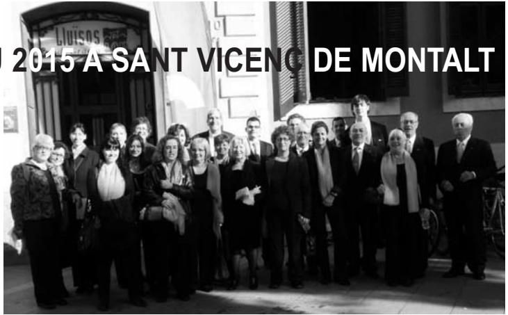
Imatge d'arxiu de la Coral Xabec als Lluïsos de Gràcia