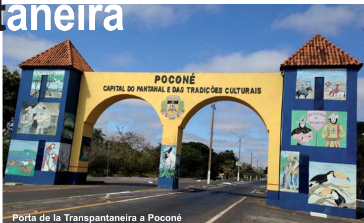
Porta de la Transpantaneira a Poconé

Eren temps del miracle econòmic brasiler sota el govern de la Junta Militar presidida pel general Emílio Médici i l'obra va néixer amb l'ufanisme propi de les grans empreses patrocinades pels pròcers que vetllaven pel benestar dels brasilers i lluitaven contra el dimoni comunista... Era el somni de progrés en una de les regions més boniques i aïllades de Brasil. La nova carretera tindria més de 400 quilòmetres i uniria les ciutats de Poconé i Corumbá , ja a l'estat de Mato Grosso do Sul i ciutat fronterera amb Bolívia . Seria una via que