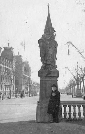
Estàtua de Rafael Casanova quan estava al Passeig de Sant Joan.