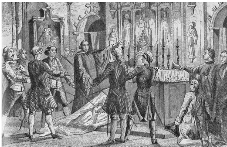
El Jurament de Santa Eulàlia, que van fer els capitans defensors de la ciutat al començament del setge, el 1713.