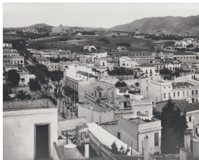
El Masnou - actualment el passeig Roman Fabra

I tal com deia una àvia molt espavilada: En tot temps les oques han tingut bec. ✱