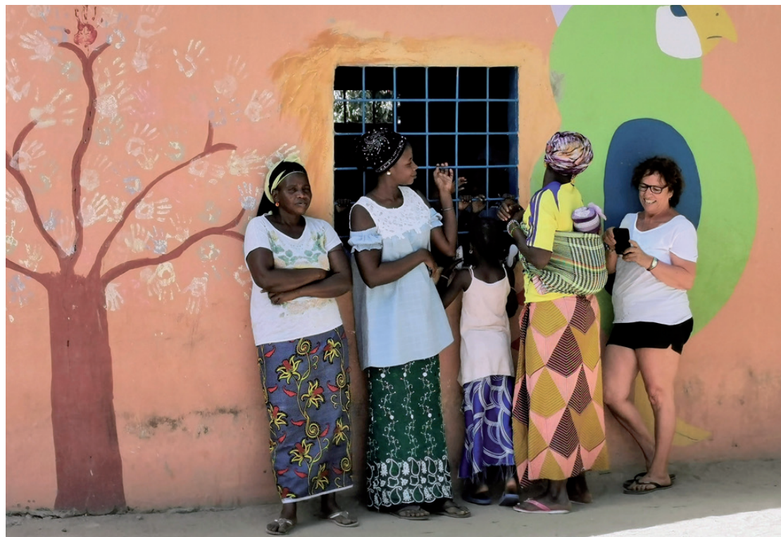
Mares joves esperant a la sortida de l'escola

A més, fruit de la seva experiència en pediatria, continua portant material molt específic per a l'atenció