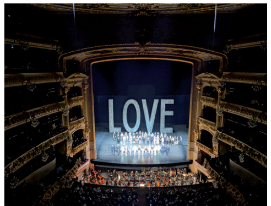
El Liceu a la representació de Manon Lescaut de Puccini

El poeta Joan Brossa deia que hi havia dues classes de vocalistes: els cantants i els microfonistes. I encara que totes dues variants ens poden arribar al cor amb les seves cançons, hi ha diferències constatables.