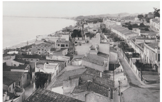
El Masnou - actualment el carrer Sant Pere

CINQUENA. En aquest cas, també del tèxtil, la cosa va anar un xic a l'inrevés, ja que era la dona, casada també, que, tot fent la seva feina, que era dur material amb un carret, d'una planta a l'altra, com que era un muntacàrregues, es posava, quan veia a l'encarregat que l'interessava, de forma que des de baix veiés cuixa, i quan s'apropava se la veia posar-se bé la bata, just per ensenyar pit. Allà ella si així obtenia premi.