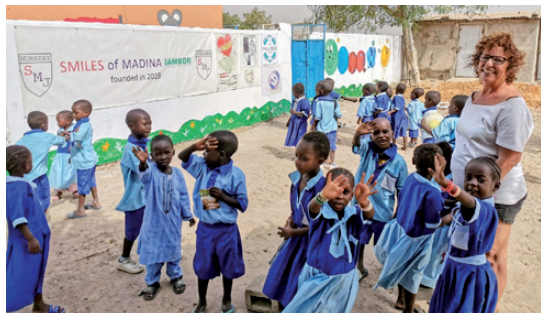
El 2020, l'autor del reportatge va fer aquestes fotografies a Gàmbia

La seva trajectòria professional va estar marcada des del principi per una vocació de servei clara. Va estudiar infermeria, quan encara s'anomenava ATS, després de descartar medicina i entendre que el que realment li encaixava era el tracte directe amb els pacients.