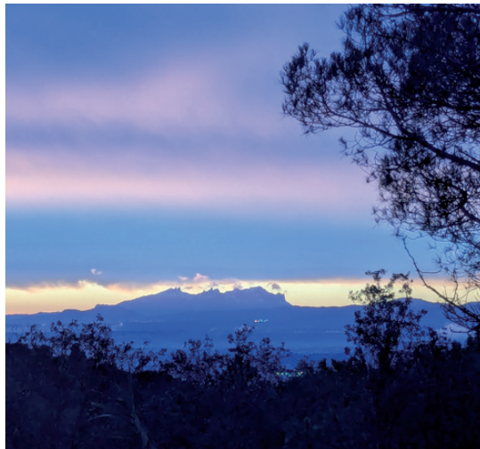
Capvespre sortint de la festa de l'Enric Badal

Durant la representació sovint observo l'orquestra per recordar-me que la música que escolto és interpretada allà mateix, en l'instant que compartim, perquè la música en directa és un autèntic privilegi. Aquí hi rau, també, l'autenticitat del teatre. ✨