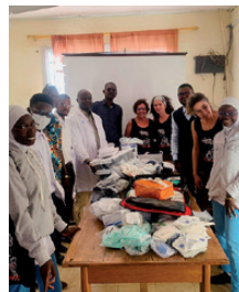
Imatges facilitades per Il·lusions per Gàmbia d’alguns dels seus projectes