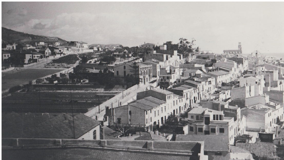
El Masnou - vista parcial

SISENA. A una altra, aquesta no del tèxtil, també hi havia un torero d'aquestes, i això que semblava un sopes, però també provava sort entre el personal femení.