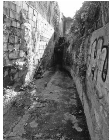
Un tros on encara passa a cel obert, a prop del c/ Meridià.