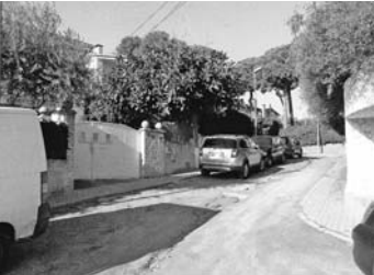
El mateix sector actualment.