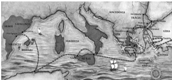
L'aventura dels almogàvers

Mancats d'objectius polítics, el 1307 els almogàvers van entrar al servei de Carles de Valois i després del duc d'Atenes, Gautier de Brienne, però van tornar a ser traïts pels qui els van contractar, i van revoltar-se i van derrotar els francesos en la batalla de Cefís on va trobar la mort el mateix Duc amb la qual cosa es van apoderar del ducat d'Atenes. El 1318 els catalans van eixamplar els seus dominis al nord amb la invasió de la zona de Tessàlia, on van crear el Ducat de Neopàtria. La Companyia Catalana d'Occident es va organitzar llavors en república militar i va esdevenir titular legal dels dos ducats i foren governats per institucions pròpies en les quals els funcionaris es regien pels Usatges de Barcelona sota el vassallatge nominal del rei de Sicília. El català es va convertir en l'idioma oficial als dos territoris i es va intentar sempre de repoblar els ducats amb catalans, cosa que no va reeixir a causa de la gran distància que hi havia des de Catalunya. El domini català sobre els dos ducats es perllongà fins al 1388 després que una flota florentina va assaltar Atenes i dos anys més tard Neopàtria, i es desfeu per sempre la presència catalana a Orient.