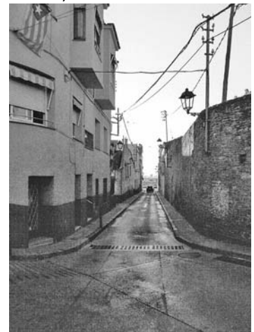
Tros entre els carrers Rafael Casanova i Jacint Verdaguer (carretera)

De «matovelles», que es devia trobar a l'actual carrer de les Guilleries, el torrent