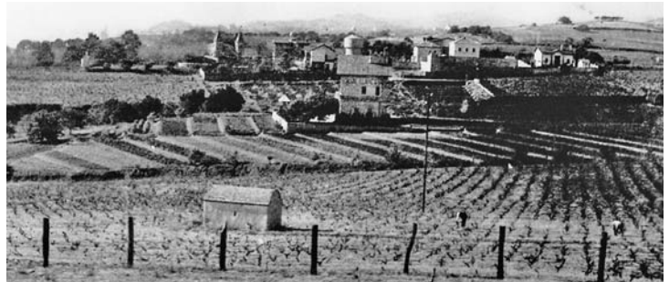
Vista del tram entre els actuals carrers de Navarra i Lluís Millet. Al mig hi podem veure la masia de can Mallafré (antiga de Can Xala)

Quan eixamplaren el port esportiu fins a la riera d'Alella, canalitzaren també aquest sector, i el feren desembocar, per mitjà d'un angle recte, a l'esmentada riera. Fet amb tan mala traça que