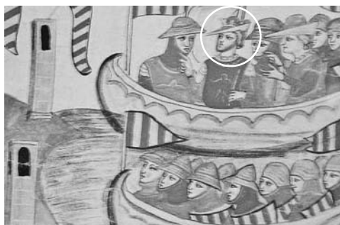
Desembarcament veloç de Pere el Gran a Trapani. Es pot identificar el rei duent la corona.

Tot i que l'amenaça militar francesa no va desaparèixer mai, a partir del 1286 els catalans van obrir negociacions perquè es reconegués la seva hegemonia sobre l'illa. La situació és va estabilitzar el 1302 amb la pau de Caltabellota. Tot i que l'acord limitava la influència catalana sobre Sicília, el regnat del rei Frederic II, fill de Pere i Constança, va provocar que el control dels catalans es perllongués a l'illa per més d'un segle i mig. Durant tots aquests anys les relacions en tots els sentits van ser intenses. Una prova d'això va ser la vintena de consolats establerts a l'illa per fomentar