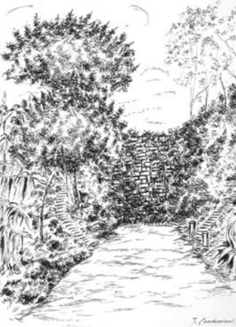
I també en un dibuix de Josep Condeminas.

tades cinc cases, al lloc que hi havia per saltar l'aigua fou substituït per un embornal quadrat, que posteriorment desaparegué en canalitzar el torrent (en aquest lloc en angle recte) i i el feren desembocar a la riera d'Alella. Ara al lloc de l'embornal hi ha l'aparcament de l'estació del Masnou.