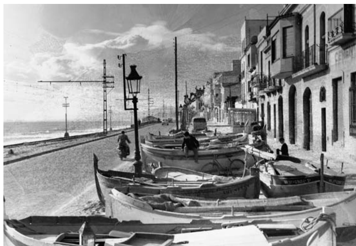
Barques al veral d'Ocata

En el butlletí del passat mes de febrer hi va haver un error en una fotografia de les Històries de la Vila . El peu d'una foto, repetida, era el que corresponia a la imatge de la portada de la mateixa revista. Lamentem l'errata.