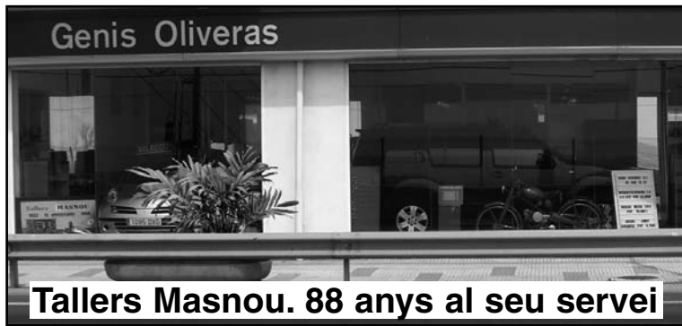
Tallers Masnou. 88 anys al seu servei

Exposició i venda: Àngel Guimerà, 14. Taller: Puerto Rico, 28 93 540 31 57 el Masnou