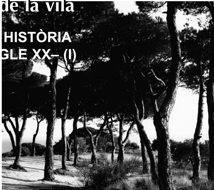
Els Pinetons.

Dalt del turó que hi ha a un costat, hi havia els no menys cèlebres Pi de l'Índia i el Garrofer del mateix nom, el primer