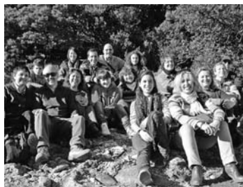
Fotografia a Montserrat, on vam poder ser quasi tots els vuit cosins Maresma.