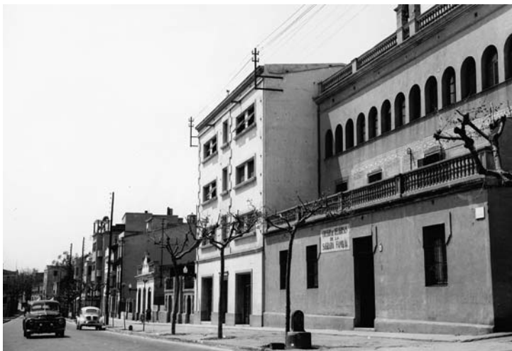
Col·legi de la Sagrada Família.

L'edifici més a l'esquerra de la imatge, amb un anunci a la façana de la Granja Meya, negoci que estava a la part alta del poble, on ara hi ha el c/ Palma de