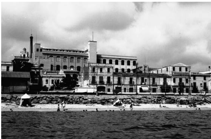
Fàbrica de Can Xala.

A la imatge, dels anys cinquanta, la podem veure des de mar, quan encara no hi havia el port esportiu. Tenia l'estació del ferrocarril més cap a