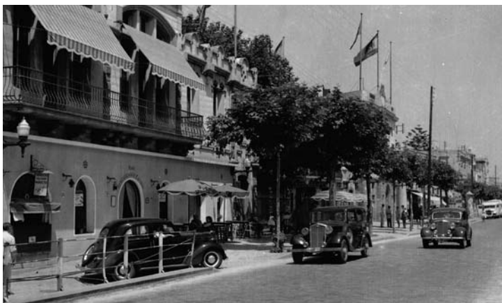
El Casino i l'Ajuntament.

El Casino llueix la seva bandera, però amb el viu de l'espanyola, i sobre la rotonda treia el cap per sobre els arbres també la de l'estat. A l'Ajuntament, les úniques banderes que podien posar eren tres: la de la Falange, l'estatal i la del Requetè. Ni la del Masnou, i molt