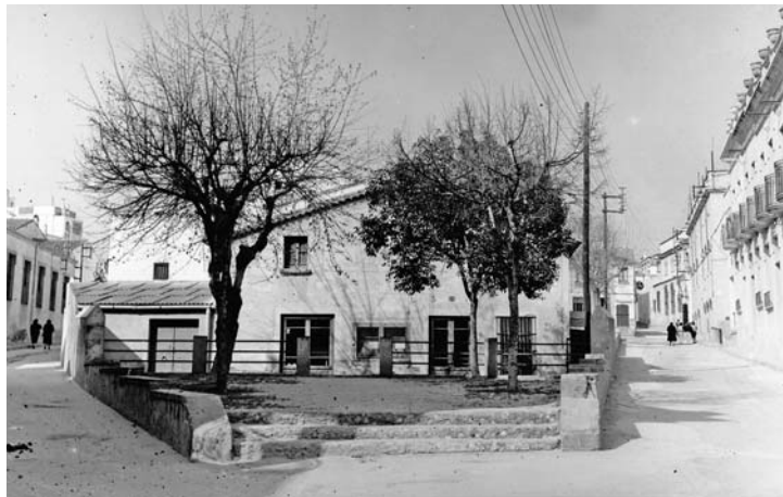
La cooperativa.

Aquesta casa fou coneguda popularment per aquest nom, ja que, en ella, abans de la guerra hi va haver la Cooperativa, i després era el lloc on es